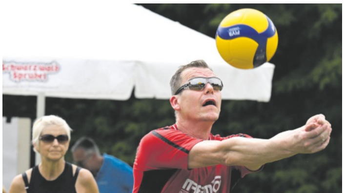
Beim Volleyball Turnier sah man schöne Ballwechsel.