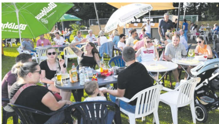
Beim spanischen Abend und der After-Work-Party konnten die Gäste sich noch von der Sonne und dem TV Auenheim verwöhnen lassen.