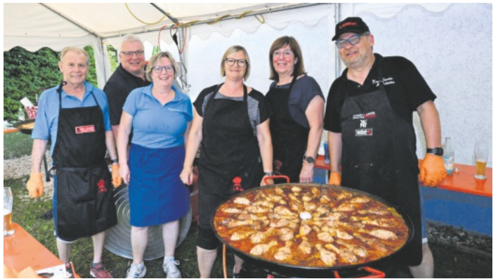
Drei große Pfannen mit Paella wurden den Gästen von diesem Team des TV Auenheim angeboten.

Weitere Bilder haben wir auf unserer Homepage www.tv-auenheim.de eingestellt.