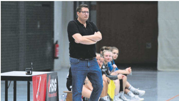
HSG-Frauentrainer Thorsten Sasse kündigte seinen Rücktritt nach der Saison an.

Samstag, 16.11.2024, Mörburghalle, Schutterwald 15:30 Uhr, TuS Schutterwald 3 - HSG Hanauerland 2