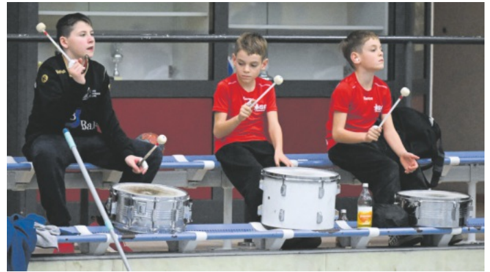
Die Unterstützung der Fans ist bei der HSG Hanauerland auch durch den Nachwuchs garantiert. Dies drei Jungs waren in der KT-Arena 60 Minuten nicht zu überhören.