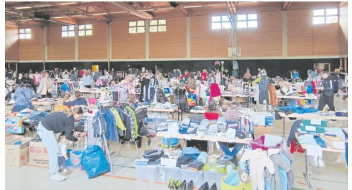
Ein tolles Angebot und viele Besucherinnen und Besucher beim Herbstbasar

Auch die Ladies Shopping Night des Frauenvereins war wieder ein voller Erfolg. Viele Interessierte bummelten durch die Tischreihen und ergatterten schicke Hosen, Oberteile, Mäntel oder Accessoires. Die Gäste konnten nach Herzenslust nach Lieblingsteilen stöbern und anschließend bei Cocktails und Häppchen gemütlich plaudern; ein rundum gelungener Abend! Wir möchten uns bei allen Verkäufer*innen und Gästen beider Veranstaltungen herzlich bedanken! Ein großes Dankeschön auch allen Helferinnen und Helfern sowie all denjenigen, die mit Kuchen Spenden zum Gelingen des Basars beigetragen haben. Herzlichen Dank dem Vielfältigen Kork e.V. für die Beleuchtung sowie dem Sportverein Kork für die tatkräftige Unterstützung beim Abbau!