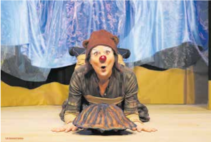
Der Biber mit dem sprechenden Namen Biba steht bei „Die Perle“ im Mittelpunkt des Geschehens. Das für Kinder ab vier Jahren geeignete Stück wird vom Theaterduo pohyb's und konsorten gespielt.